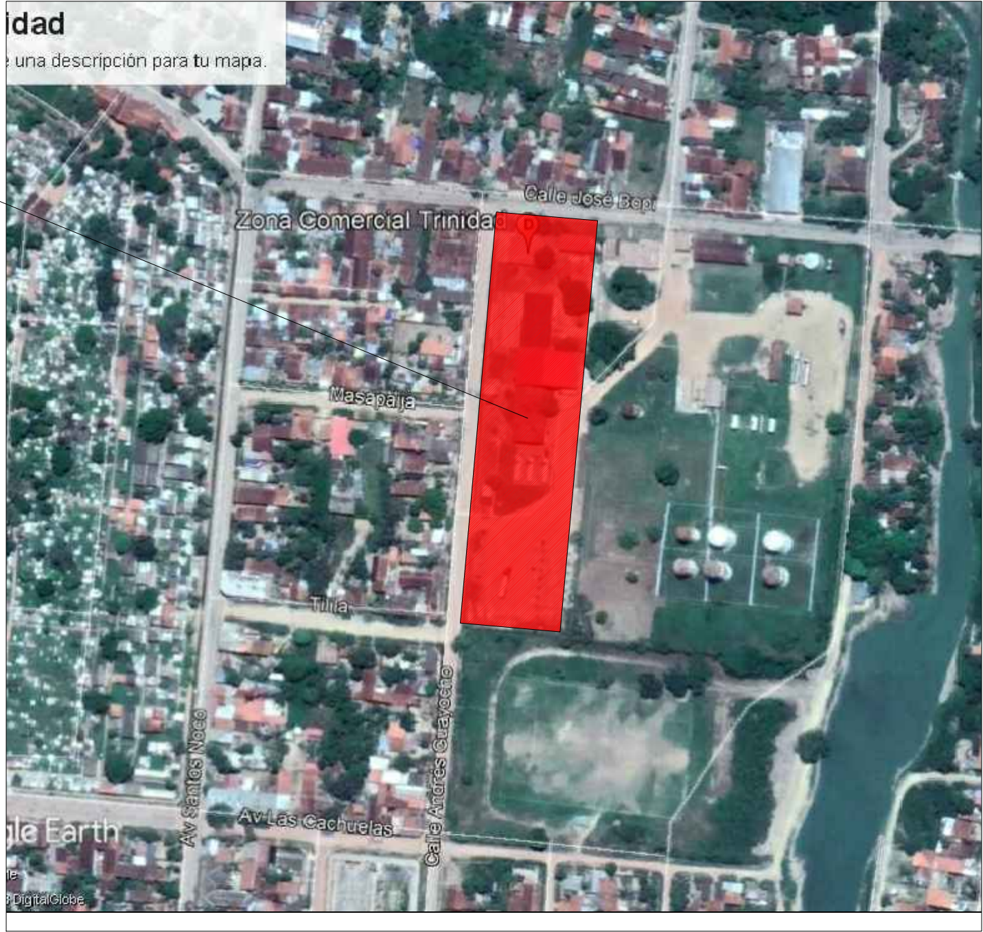
PLANO DE UBICACION